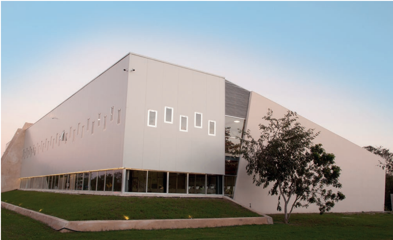
Cumple con la norma: NOM-008-ZOO-1994.